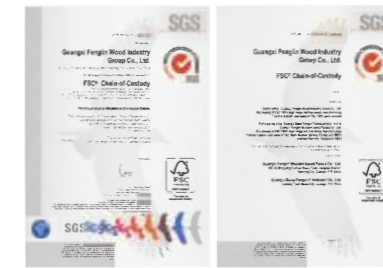
FSC-COC森林认证-产销监管链认证