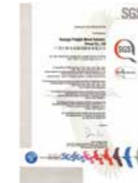
美国加利福尼亚CARB认证