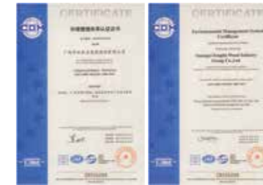
ISO14001国际环境管理体系认证