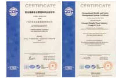
OHSAS18001职业健康安全管理体系认证