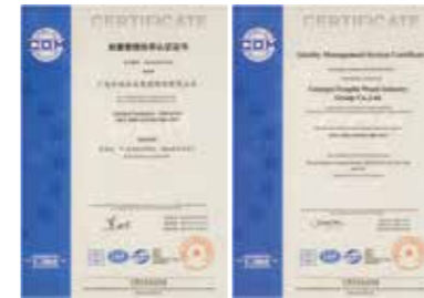
ISO9001国际质量管理体系认证