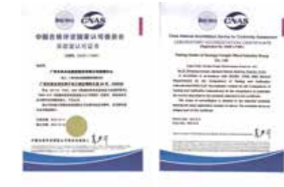
中国合格评定国家认可委员会实验室 认可证书CNAS