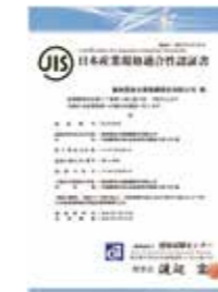
日本工业标准JIS认证