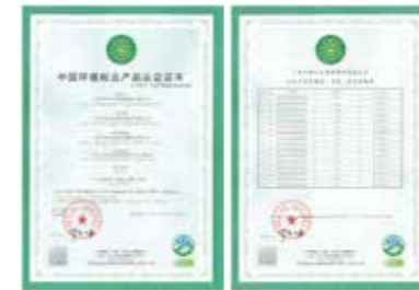
中国环境标志产品认证